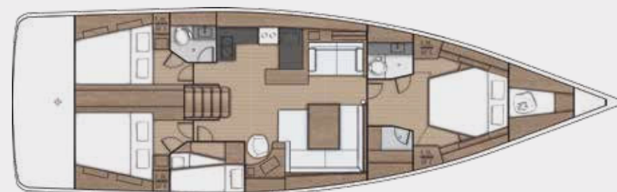
LOWER DECK 4 cabins, 2 bathrooms version - Version 4 cabines, 2 salles d'eau