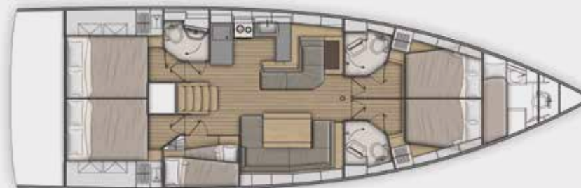
LOWER DECK 5 cabins, 3 bathrooms version - Version 5 cabines, 3 salles d'eau