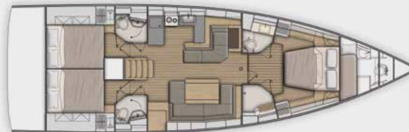
LOWER DECK 3 cabins, 3 bathrooms version - Version 3 cabines, 3 salles d'eau