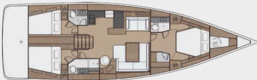
LOWER DECK 3 cabins, 3 bathrooms version - Version 3 cabines, 3 salles d'eau