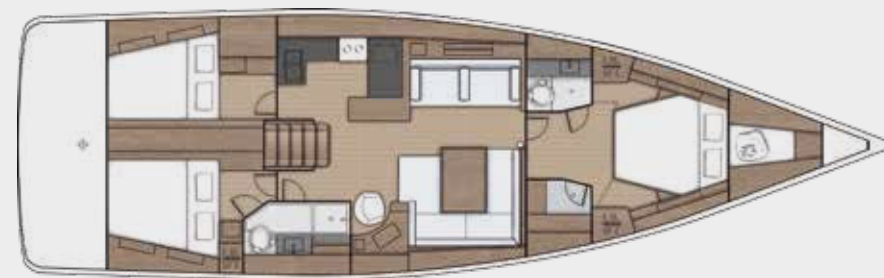
LOWER DECK 3 cabins, 2 bathrooms version - Version 3 cabines, 2 salles d'eau