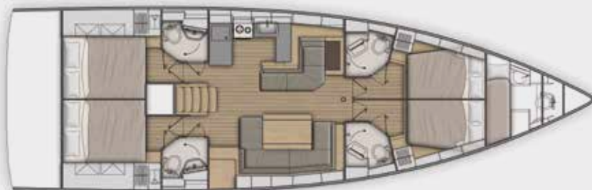
LOWER DECK 4 cabins, 4 bathrooms version - Version 4 cabines, 4 salles d'eau