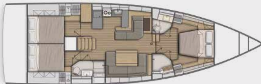
LOWER DECK 3 cabins, 2 bathrooms version - Version 3 cabines, 2 salles d'eau