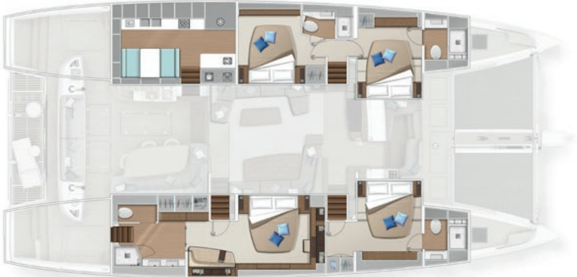
4 cabins - 4 cabines