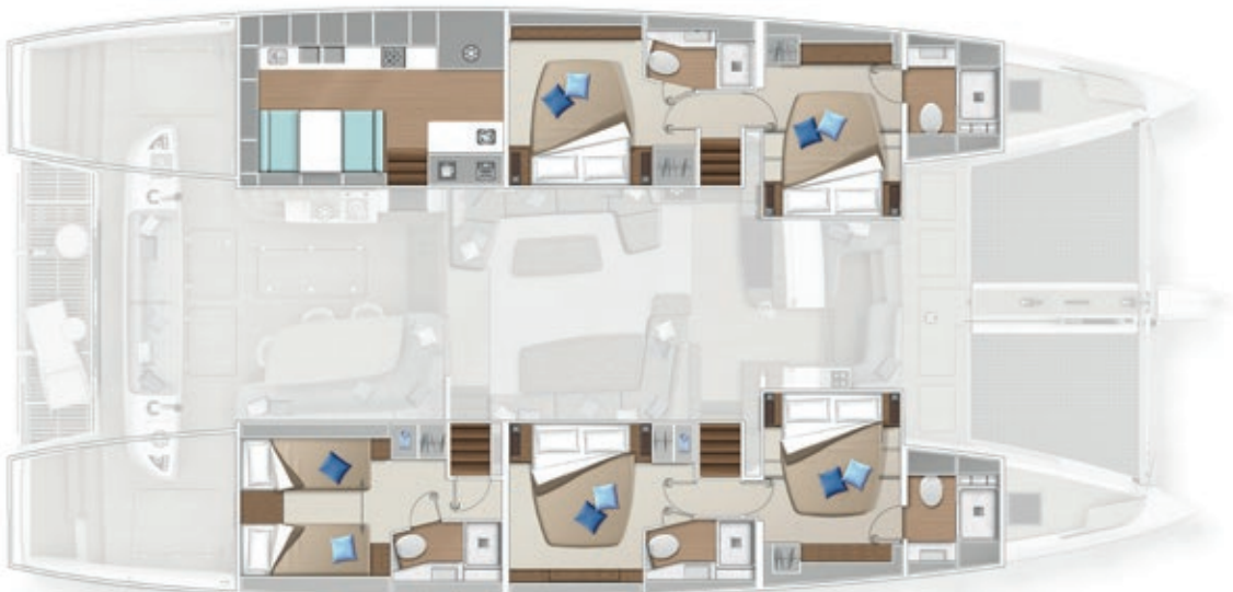
5 cabins - 5 cabines